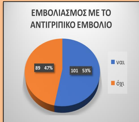
Διάγραμμα 1: Σχηματική απεικόνιση του ποσοστού των συμμετεχόντων που έχουν ή μη διενεργήσει αντιγριπικό εμβολιασμό κάποια στιγμή της ζωής τους.

Το 53% των συμμετεχόντων είχε εμβολιαστεί έστω και μια χρονιά με το αντιγριπικό εμβόλιο ενώ το 47% δεν είχε εμβολιαστεί ποτέ (Διάγραμμα 1). Στο Διάγραμμα 2 σημειώνονται τα συνολικά έτη σε αριθμό, που οι συμμετέχοντες διενέργησαν εμβολιασμό.